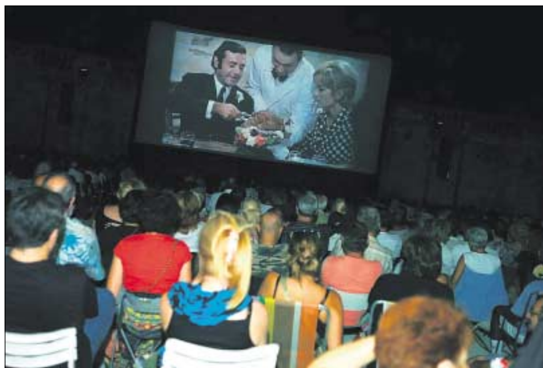
Toujours autant de monde pour une tranche de plaisir aux jardins de la Fontaine.