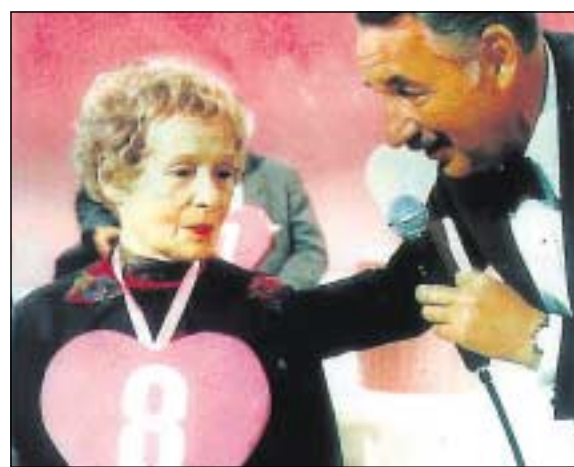
Philippe Noiret, présentateur de jeux télévisés.

« Noiret s'était fait la tête de Bellemare »